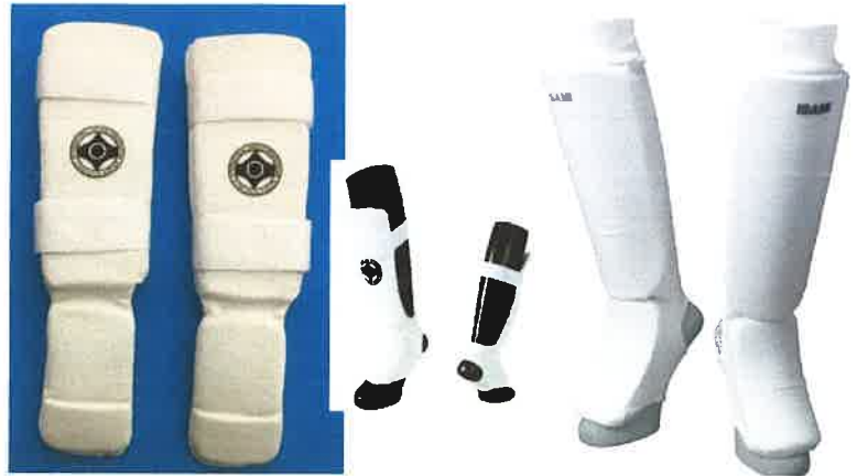
スネサポーター <着用:高校生・シニア男女>(個人で用意)