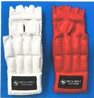
グローブ<着用:高校生・シニア男女>(主催者貸出し)