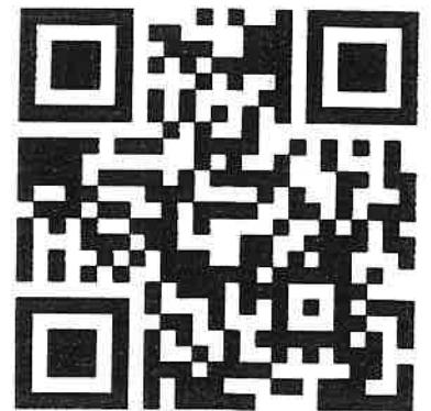
ログイン QR コード