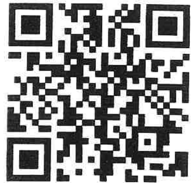
新規登録 QR コード

ログイン後、登録したお写真が画面右上に表示されます。クリックするとデジタル会員証が開きます。編集もそこから可能となります。